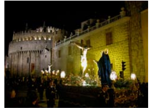
Procesión de Semana Santa