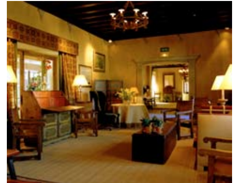
Parador Raimundo de Borgoña

Dirección: Marqués de Canales y Chozas, 2. Teléfono: +34 920 21 13 40. Precio: desde 120 € doble. Web: www.parador.es