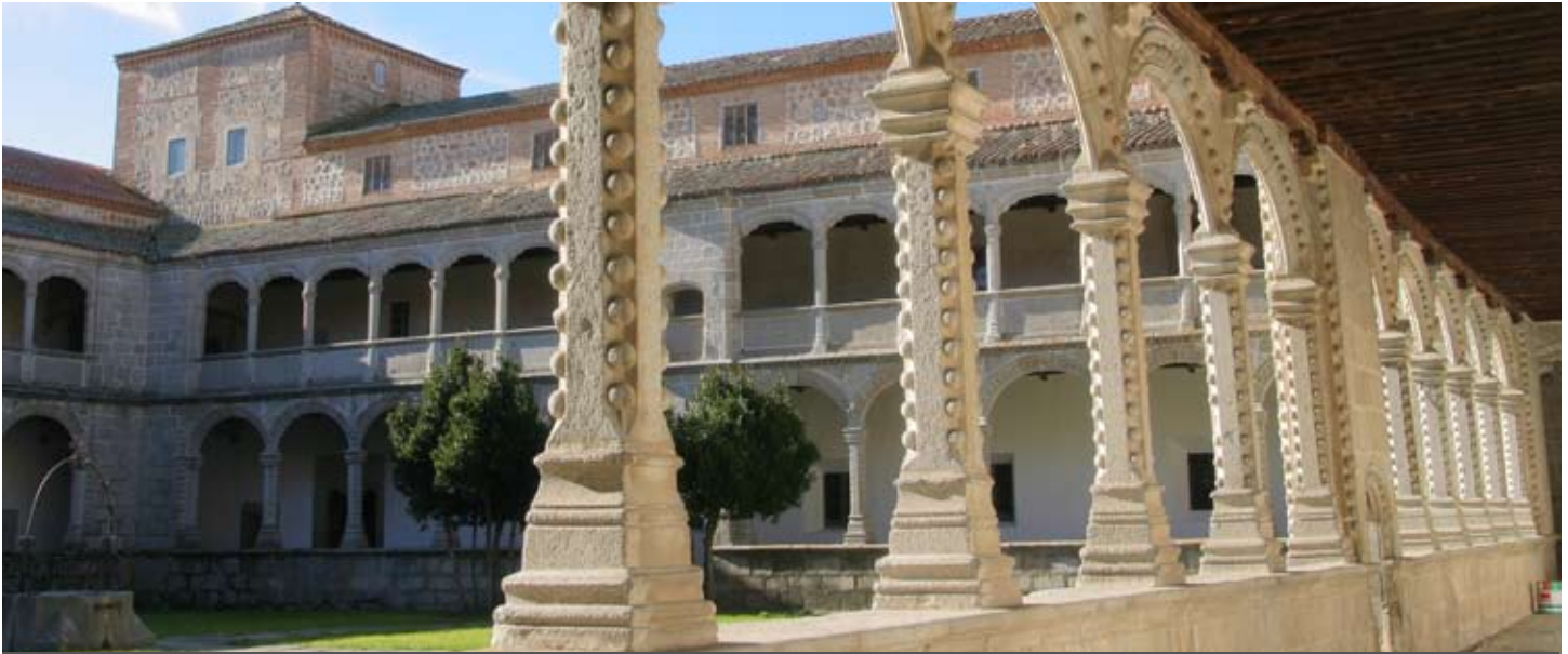
Monasterio de Santo Tomás, claustro