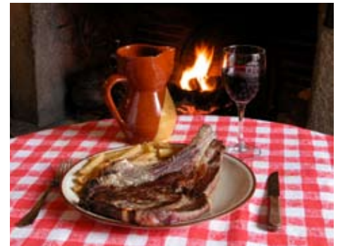
Chuletón en El Rastro

Dirección: Plazuela del Rastro, 1. Teléfono: +34 920 21 12 18. Precio: de 20 a 30 euros.