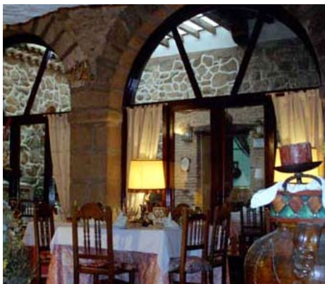
Hostería de Bracamonte

Dirección: Tomás Luis de Victoria, 3. Teléfono: +34 920 25 37 09. Precio: de 30 a 50 euros.