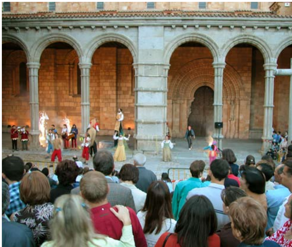
La Ronda de las Leyendas

Avenida de Madrid, 39. Teléfono: +34 920 22 59 69. Web: www.avilaturismo.com