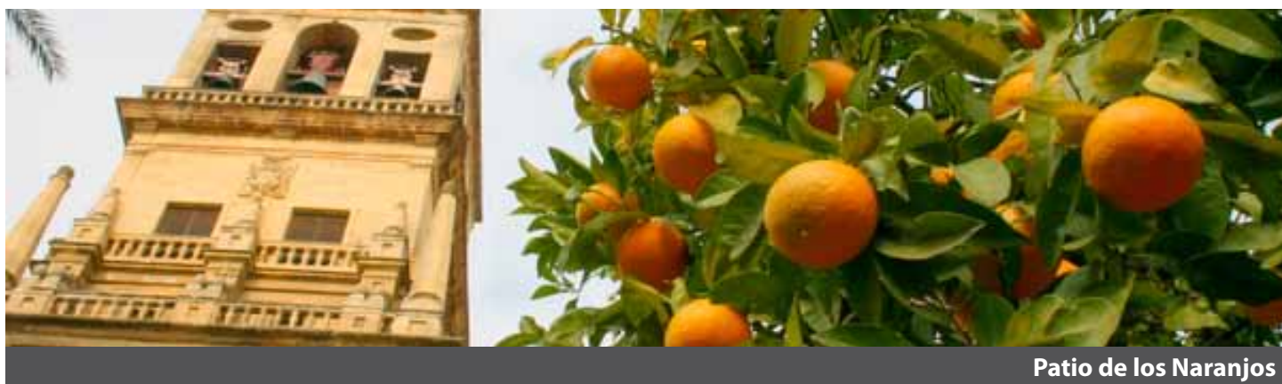
Patio de los Naranjos