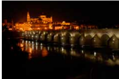
Vista nocturna del puente romano

Cuenta la leyenda que fue la celestial aparición de un ángel a Abaderramán I la que llevó al emir a ordenar la construcción de la mezquita. Tras una noche en la que su espíritu cayó preso del demonio, ahogado en un mar de sangre y desfiliando ante su vista los episodios más sangrientos