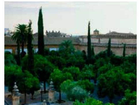
Patio de los Naranjos

Hay que colocarse en cualquier rincón del patio de los Naranjos para imaginarse cómo debía transcurrir la vida diaria en este espacio que durante el Califato ejercía de plaza pública de la ciudad. Especialmente si era viernes, la hora de los rezos y el imán y su séquito bajaban en procesión camino del mimbar, el púlpito desde el que convocaba