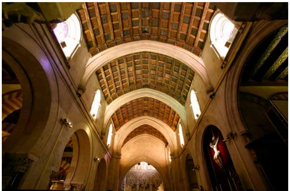
En el interior de la catedral se puede observar la superposición de estilos