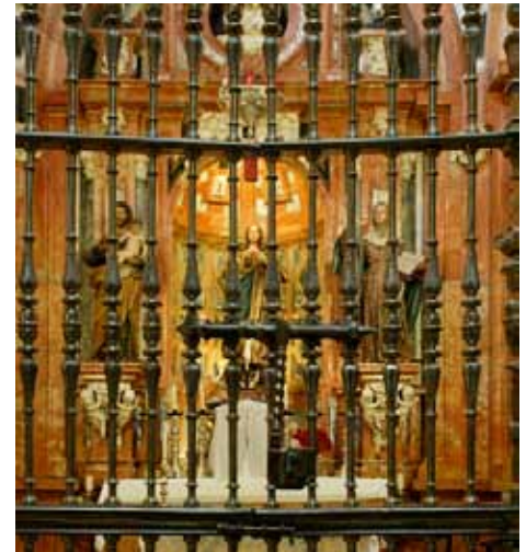
Capilla de Nuestra Señora de la Concepción

Es la capilla más importante del lado occidental y desde la Edad Media ocupa el espacio dedicado al baptisterio. Proyectada en 1679, sobresalen en ella las pinturas de la bóveda de la antecapilla, la portada de mármol rojo y las imágenes de Pedro de Mena del retablo Mayor.