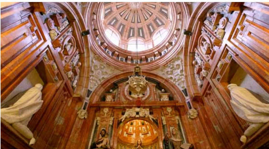
Capilla de Santa Teresa

En una esquina, junto a la Sacristía, se encuentra la que fuera antigua Capilla de Santiago. Acoge el Sagrario catedralicio desde 1571. Sus tres naves están pintadas al fresco en el último tercio del siglo XVI con un claro influjo manierista.