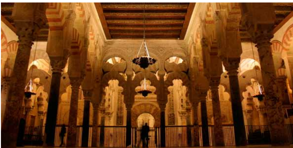
El mirhab y la maqsura

El mirhab, el muro al que se dirigen las oraciones de los fieles y lugar donde se exponía originalmente el Corán, y la maqsura, el espacio adyacente reservado al califa, son todo un alarde de refinamiento arquitectónico y ornamental. El primero es de forma octogonal, con una cúpula en forma de concha y resplandece con brillantes mosaicos de dibujos florales e inscripciones arábigas creados por artistas bizantinos enviados por el emperador de Constantinopla. Sobre la maqsura centellea la bóveda más hermosa de la mezquita, de mármol y también revestida de mosaicos.