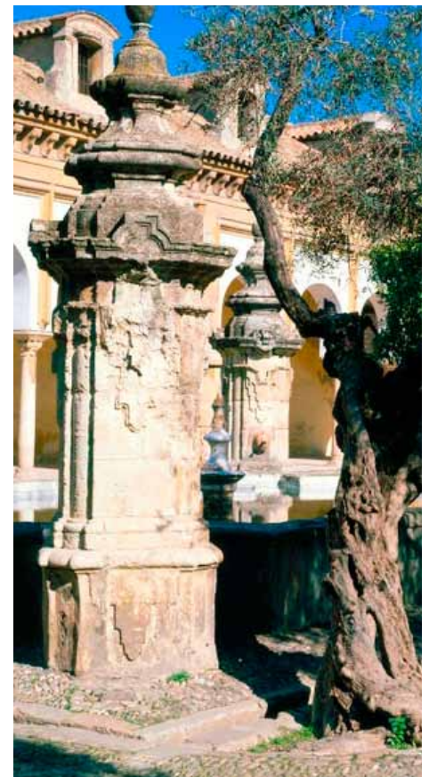
Fuente de Santa María