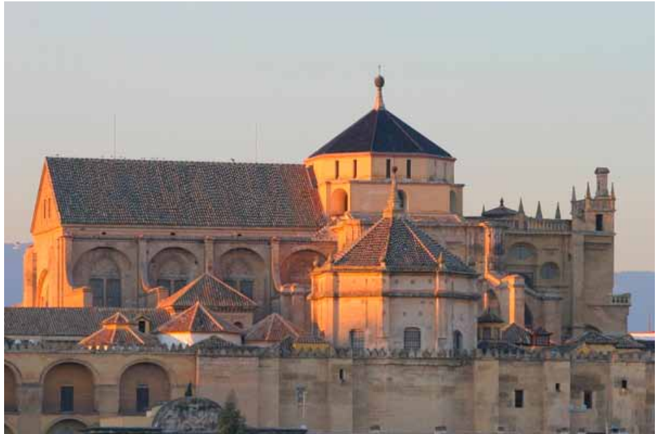
La altura de la catedral es superior a la de la mezquita

por Juan de Ochoa, los púlpitos tallados en mármol, el retablo mayor, una importante filigrana marmórea renacentista, o sus tesoros artísticos.