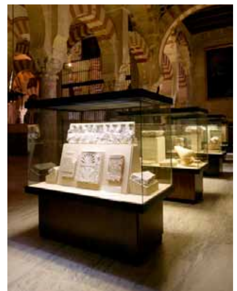
Museo de San Vicente