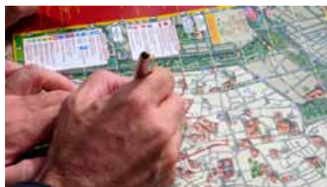
Callejero de Córdoba