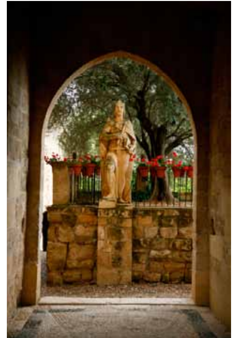
Alcázar de los Reyes Cristianos

del famoso pintor cordobés Julio Romero de Torres, a quien la ciudad ha dedicado un museo. Es también esta calleja un lugar idóneo para admirar una bella vista de la torre de la catedral o para hacer acopio de productos artesanos tradicionales en las tiendas de recuerdos, como las que también se suceden en la cercana Cardenal Herrero.