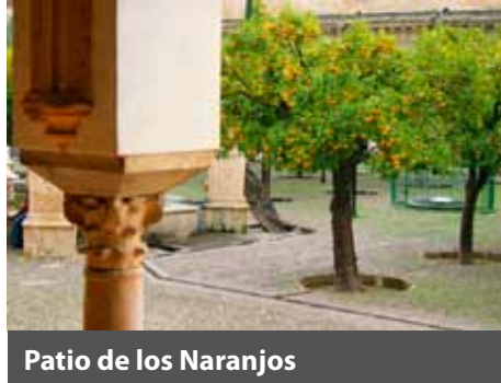
Patio de los Naranjos

El bosque de columnas que se levanta en este espacio es un paraíso en piedra erigido por los mejores arquitectos. Una obra sin precedentes que condicionó el futuro de la arquitectura islámica. A lo largo de sus diecinueve naves se elevan 856 columnas con fustes de todos los colores y formas imaginables, sobre las que vuelan arcos superpuestos de herradura y medio punto bellamente policromados que parecen recordar los de los acueductos romanos. En éstos se alternan el tono ocre