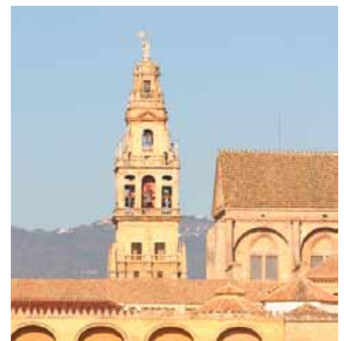
Torre-campanario de la catedral

Se alza junto a la puerta del Perdón. Es la torre más alta de Córdoba y sus 54 metros son salvados por 203 escalones que giran en torno al viejo alminar de Abd al-Rahman III, desde el que el muecín llamaba a la oración y que se conserva en el interior de la mole barroca. El campanario, proyectado por Hernán Ruiz III, está rematado por una escultura del arcángel San Rafael.