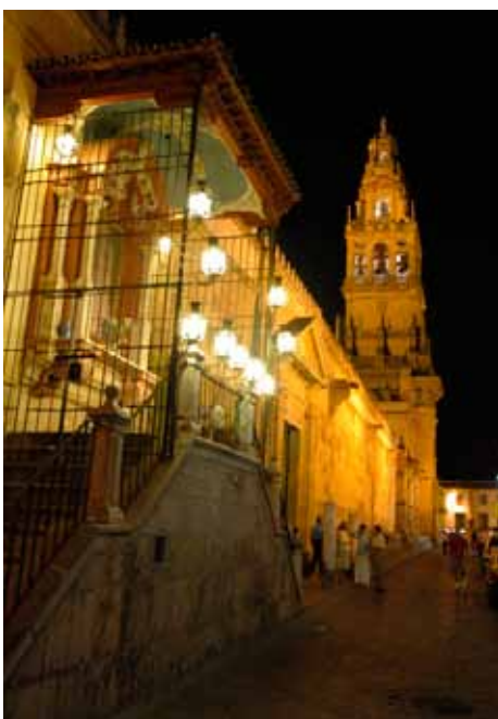
Virgen de los Faroles

Si el paseo coincide con la hora del tapeo o la comida imprescindible resulta sentarse en alguna de las mesas más emblemáticas para degustar algunos de los platos autóctonos más afamados, como el salmorejo, los flamenquines o el rabo de toro. Bodegas Campos ( www.bodegascampos.com ) o El Caballo Rojo ( www.elcaballorojo.com ) son los más tradicionales, junto a éstos, dos opciones más innovadoras: Choco ( www.restaurantechoco.com ) o el siempre lleno Pic-Nic.