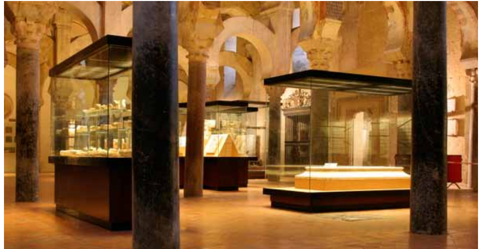
Museo de San Clemente

Se ubica en el interior de la Mezquita, en la esquina suroccidental. Expone algunas de las piezas recuperadas de la primitiva basílica cristiana, construida entre los siglos VI y VIII, y