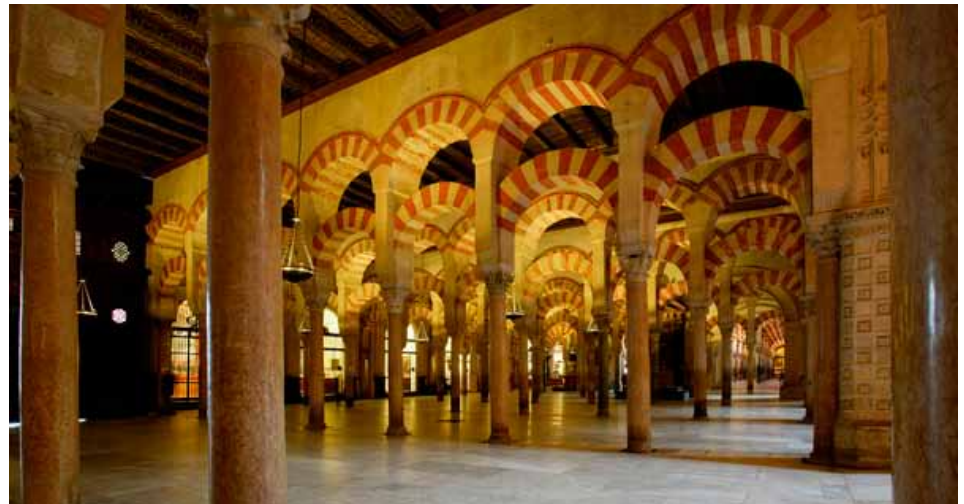
Interior de la Mezquita

cristiano al edificio. En el siglo XVI y gracias al apoyo del emperador Carlos V, comenzaría la erección de la catedral en el centro del recinto islámico, destruyendo parcialmente el interior. Más tarde se lamentaría de ello diciendo: "Habéis destruido lo que era único en el mundo y habéis puesto en su lugar lo que se puede ver en todas partes". Casi dos siglos se tardaría en acabar y el resultado es una mezcla de estilos gótico, barroco, plateresco y renacentista.