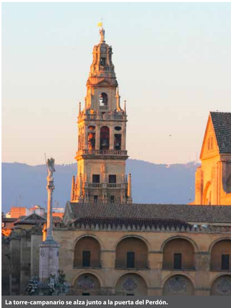
La torre-campanario se alza junto a la puerta del Perdón.

Horario: de lunes a sábado, de 10 a 17,30; domingos y festivos, de 8,30 a 10 y de 14 a 17,30. A partir del mes de marzo se amplía una hora más.