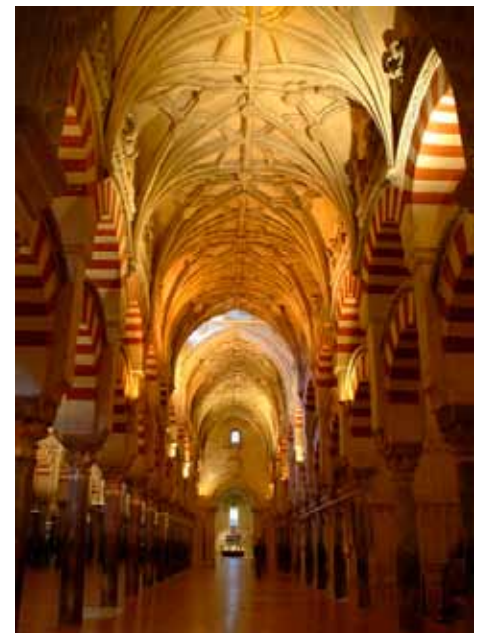
Ampliación de Almanzor

En el cénit del esplendor de Al-Andalus, Almanzor amplió la Mezquita mayor de Córdoba por última vez, doblando sus dimensiones y descentralizando el mihrab. Su ampliación está señalizada en el suelo por baldosas rojizas, en lugar del mármol que marca las tres construcciones primeras. Estas naves, levantadas en tiempos del aguerrido caudillo, son las menos afortunadas de todo el conjunto. Crecieron en dirección este y representaron un golpe de suerte para la propaganda política de su patrocinador. Con él se cierra el libro de la Mezquita musulmana y, lo que comenzó siendo un modesto templo cristiano, acabará convirtiéndose en catedral.